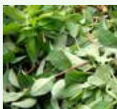
Scarti vegetali del giardinaggio: erba, rametti, foglie, fiori, rami