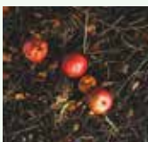
Residui non decomposti del precedente processo di compostaggio